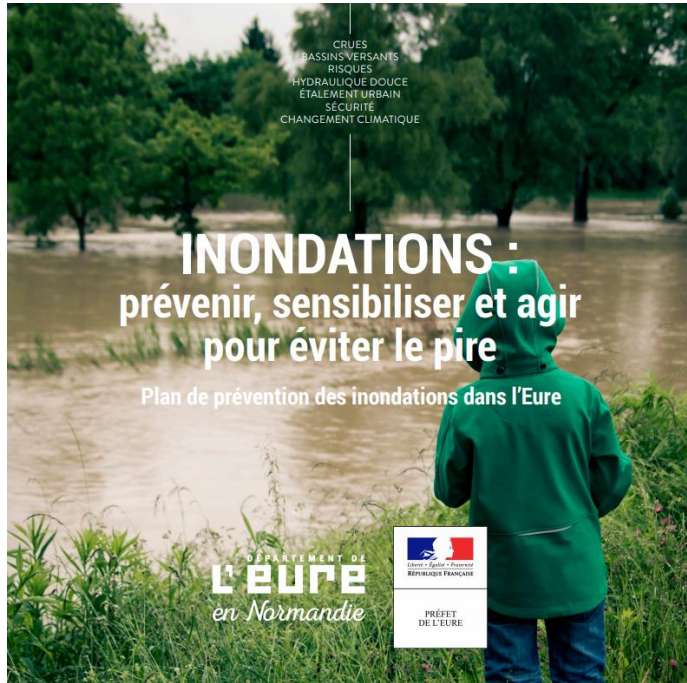
Plan de bataille Inondation

Services de l'Etat et Département s'associent pour lutter contre les inondations