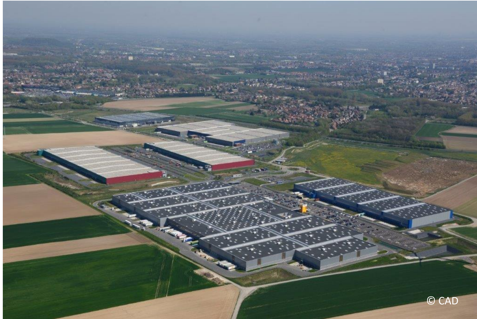
Lauwin Park – Lauwin-Planque (59)