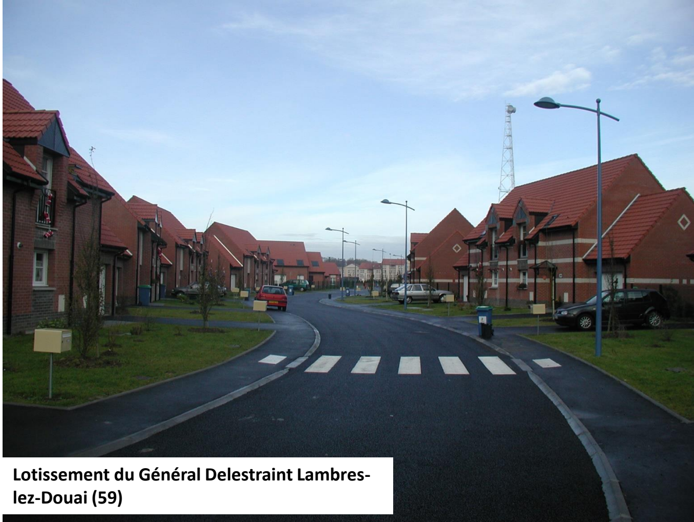
Lotissement du Général Delestraint Lambres-lez-Douai (59)

Chaussée à structure réservoir avec revêtement poreux